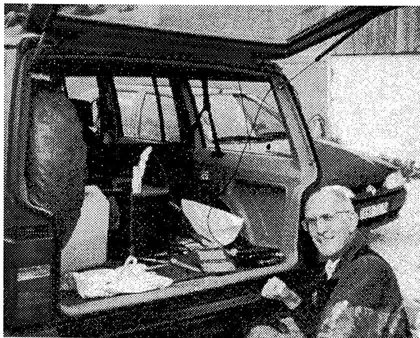
Best 73's de Reynold-Alex HB9CKR

Après l'excellent repas différentes démonstrations techniques seront présentées: réception d'images de satellites météo ainsi qu'une tentative de connexion packet à l'aide de matériel ultra compact due à notre ami Alex HB9IAL.