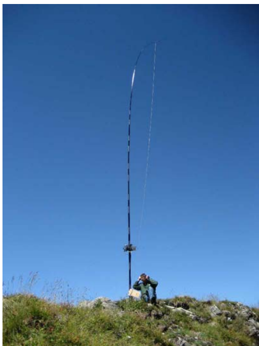
Rocher de Clé