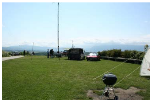
La station VHF