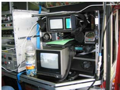
La station ATV