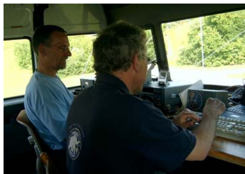
Les OM's au travail