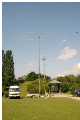
La station HF