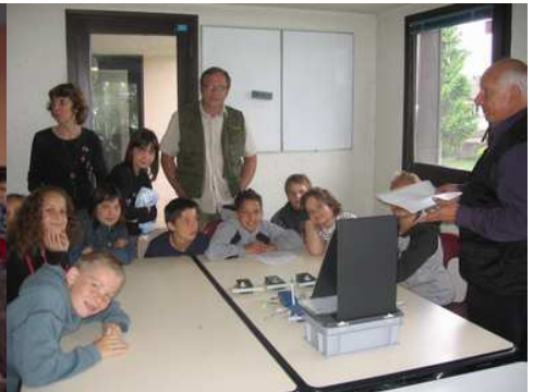
Théorie gonio au centre MJC

Tous mes remerciements aux organisateurs et au temps qui ne fut pas trop déluge.